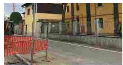
Appartamenti Cornaredo via Filanda 18