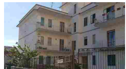
Appartamenti Torre Annunziata via Vagnola 79/bis - 155000